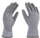
TALLAS: 6/7/8/9/10 Paquete 12 pares