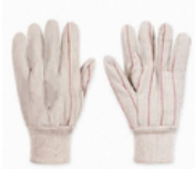
TALLAS: UNITALLA Paquete 12 pares