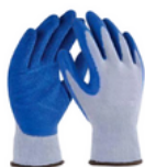
TALLAS: 7/8/9/10 Paquete 12 pares