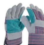
TALLAS: UNITALLA Paquete 12 pares