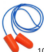
TAPON AUDITIVO DESECHABLE