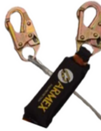
LINEA DE VIDA C/AMORTIGUADOR ACERO INDIVIDUAL GANCHO CHICO CODIGO: AR AMA1