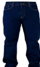
TALLAS: 32/34/36/38/ 40/42/44/46/48