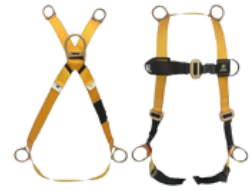
ARNES C/CAIDAS CUERPO COMPLETO 5 ARGOLLAS CODIGO: AR 5