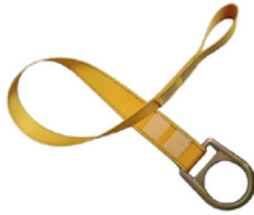
PUNTO DE ANCLAJE BANDA CODIGO: AR PF90