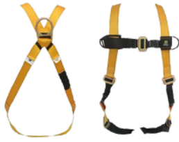
ARNES C/CAIDAS CUERPO COMPLETO 1 ARGOLLAS CODIGO: AR 1