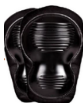
RODILLERA ANTIDERRAPANTE C/CAPSULA

TALLAS: "3" y "4" PULGADAS Paquete de 20/25 pza