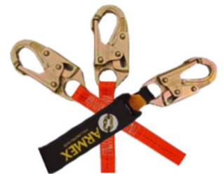
LINEA DE VIDA C/AMORTIGUADOR BANDA DOBLE GANCHO CHICO CODIGO: AR AMBP2CH