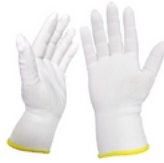
TALLAS: 6/7/8/9/10 Paquete 12 pares Son adecuados para la protección general de las manos en aplicaciones de trabajo liviano. El guante presenta un hilo 100% poliéster en color blanco de calibre 13.