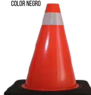
CONO DE VIALIDAD 91 CM C/BASE COLOR NEGRO