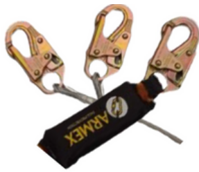
LINEA DE VIDA C/AMORTIGUADOR ACERO DOBLE GANCHO CHICO CODIGO: AR AMA2CH