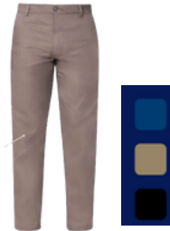
TALLAS: 28/ 32/34/36/38/ 40/42/44/46/48