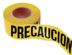
CINTA DELIMITADORA LEYENDA "PRECAUCIÓN"