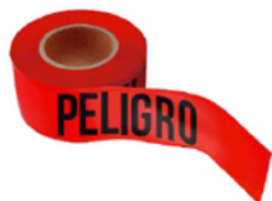
CINTA DELIMITADORA LEYENDA "PELIGRO"