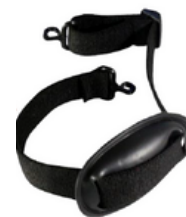
BARBIQUEJO ELÁSTICO C/MENTONERA