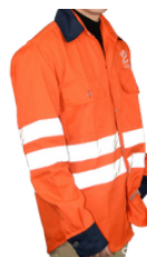
CAMISOLA ALTA VISIBILIDAD