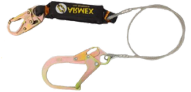
LINEA DE VIDA C/AMORTIGUADOR ACERO INDIVIDUAL GANCHO GRANDE CODIGO: AR AMA16