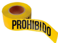
CINTA DELIMITADORA LEYENDA "PROHIBIDO"