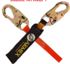
LINEA DE VIDA C/AMORTIGUADOR BANDA INDIVIDUAL GANCHO CHICO CODIGO: AR AMBP1