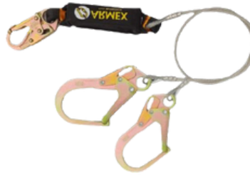
LINEA DE VIDA C/AMORTIGUADOR ACERO DOBLE GANCHO GRANDE CODIGO: AR AMA2G