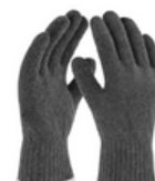
TALLAS: UNITALLA Paquete 12 pares (33/43/70 GRAMOS)