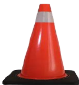
CONO DE VIALIDAD 71 CM C/BASE COLOR NEGRO