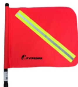
BANDERIN DE LONA C/VASTAGO PVC C/REF.