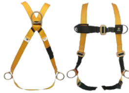
ARNES C/CAIDAS CUERPO COMPLETO 3 ARGOLLAS CODIGO: AR 3