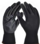
TALLAS: 6/7/8/9/10 Paquete 12 pares