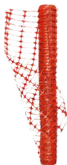
MALLA DE CONTENCION PERFORADA