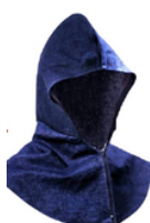
TALLAS: UNITALLA PAQUETE CON 25 PZA