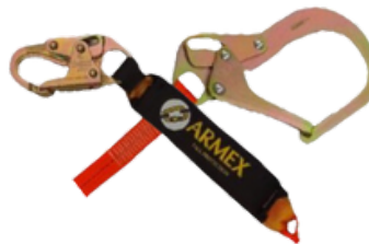
LINEA DE VIDA C/AMORTIGUADOR BANDA INDIVIDUAL GANCHO GRANDE CODIGO: AR AMBP1G