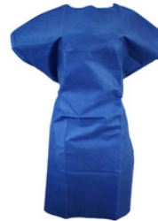
BATAS DESECHABLES PAQ/10 PZA