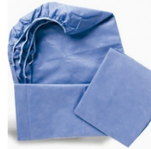
SÁBANA DE CAJÓN DESECHABLE PAQ/10 PZA