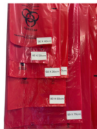
BOLSA ROJA RPBI