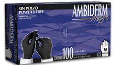
GUANTES DE NITRIL