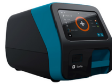
ANALIZADOR SOFIA 2

Sofia 2 es un analizador de sobremesa que utiliza detección avanzada de fluorescencia con una fuente de energía LED ultravioleta. Sofia 2 recopila cientos de puntos de datos en la tira de prueba contenida dentro de un casete de prueba Sofia FIA. Utiliza algoritmos patentados para analizar los datos, interpretar señales y determinar los resultados automáticamente para mostrar un resultado objetivo.