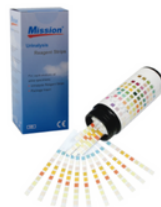
TIRAS PARA UROANÁLISIS DE 11 PARÁMETROS (ASC/GLU/BIL/KET/SG/BLO/PH/PRO/URO/NIT/LEU)