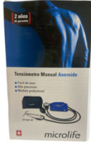
BAUMANOMETRO MANUAL CON ESTETOSCOPIO