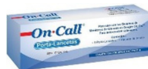
Disparador de Lanceta