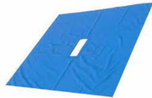
SÁBANA HENDIDA PAQ/10 PZA