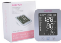
BAUMANOMETRO DIGITAL DE BRAZO